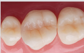
Imágenes clínicas